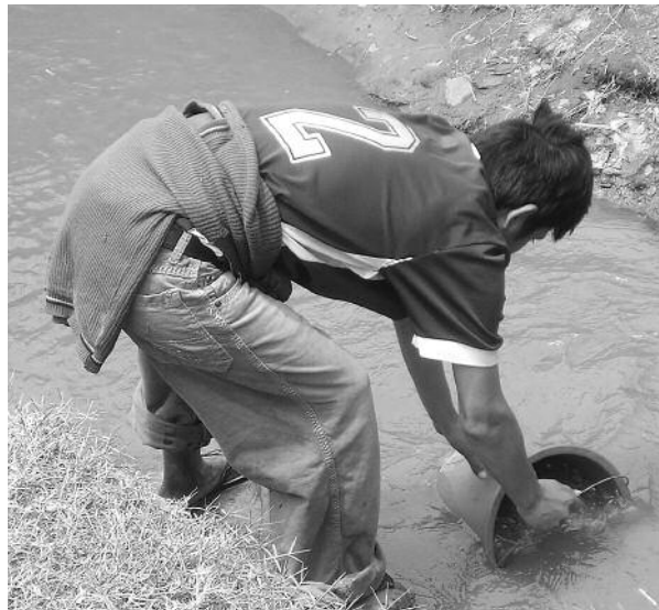
Des centaines de milliers de péruviens sont contraints à puiser et à consommer de l'eau contaminée.