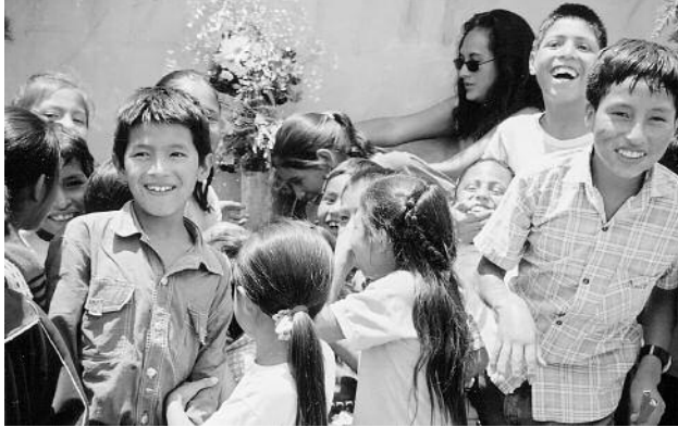
Les enfants se sont allègrement lancés de l'eau immédiatement après l'ouverture du robinet.

Le 5 décembre, les gens de La Picota, Los Pinos et Wari Acopampa ont profité de leur passage pour inaugurer la phase II du projet d'eau potable qui consistait à installer le réseau de distribution de l'eau dans ces trois quartiers situés à flanc de montagne. (voir notre Bulletin de l'automne 2003).