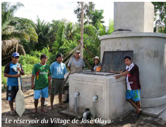
Le réservoir du Village de José Olaya

La réalisation du projet d'eau potable pour les trois communautés du petit fleuve Unini tire à sa fin. Les ouvriers terminent la construction du 3 e réservoir et des lavabos. La fin des travaux est prévue pour avril 2017 mais les pluies incessantes peuvent en ralentir le rythme. La tuyauterie est solidement accrochée au-dessus de la rivière Machintoni pour atteindre José-Olaya, le troisième village.