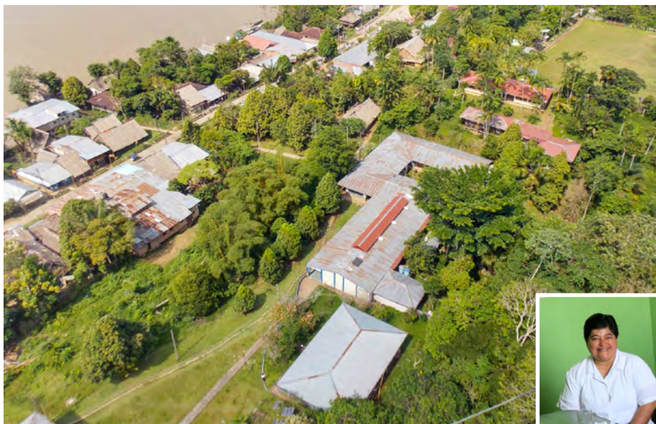
L'Hôpital de Santa Clotilde sur les rives du fleuve Napo ▲

À Santa Clotilde sur le fleuve Napo : l'hôpital