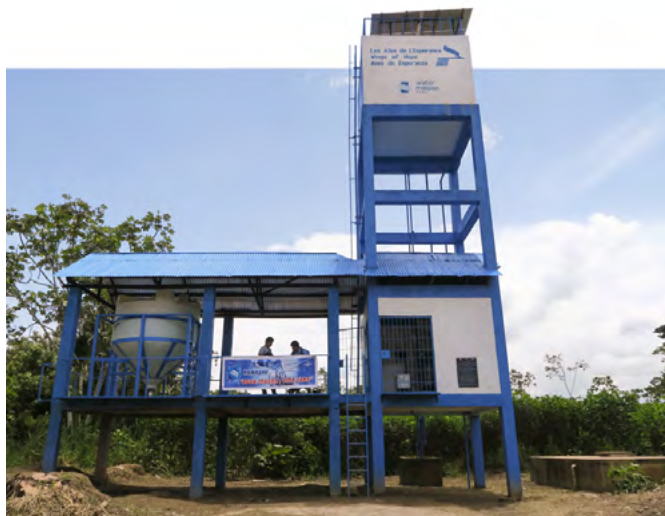
Tout le système est activé par énergie solaire

Pour en assurer une plus grande viabilité, ce projet a été redéfini. Celui que nous avons réalisé en 2003 a été bien endommagé par les crues exceptionnelles des dernières années. Dans ce nouveau projet, le pompage et le système de filtration de l'eau sont actionnés par énergie solaire. L'eau est distribuée à domicile par l'opérateur,