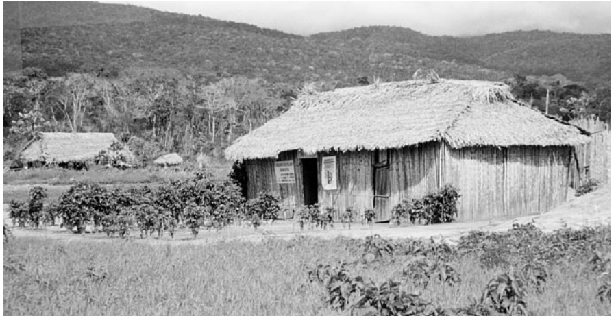
Le dispensaire de Caperucia.

MICHEL GRATTON Collaborateur et ami des Ailes