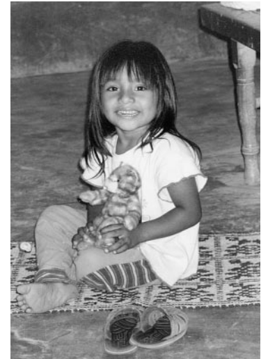
Une fillette de la région.

P.S. : Pour faire parvenir votre don, veuillez utiliser le coupon-réponse et l'enveloppe ci-joints.