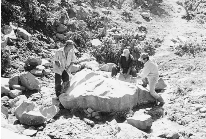
Les gens de Santa Eulalia travaillent d'arrache-pied à la réalisation de leur projet d'eau potable.

Durant ces années vécues dans la misère et l'angoisse, les missionnaires sont restés près d'eux à leurs risques et péril. Un geste de solidarité qui a profondément touché ces habitants de l'Amazonie.