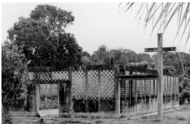
Le village de Chení a été rasé par le Sentier Lumineux en mai 1988. L'église brûlée témoigne encore de la persécution des Asháninkas durant ces années de terreur.