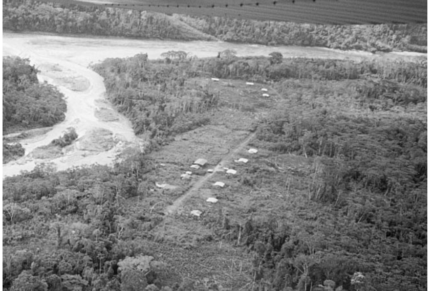
Au confluent des rivières Tambo et Cheni, nous apercevons le site partiellement défriché des futurs pâturages.

La somme de 22 765,00$ est nécessaire pour la première année du projet. L'avion de Alas de Esperanza facilitera le transport du matériel de Satipo à Cheni.