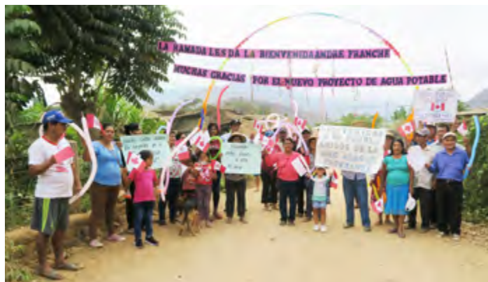
Accueil chaleureux à La Ramada