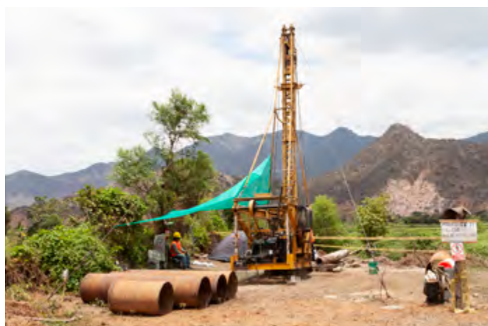
Le forage du puits de 50 mètres