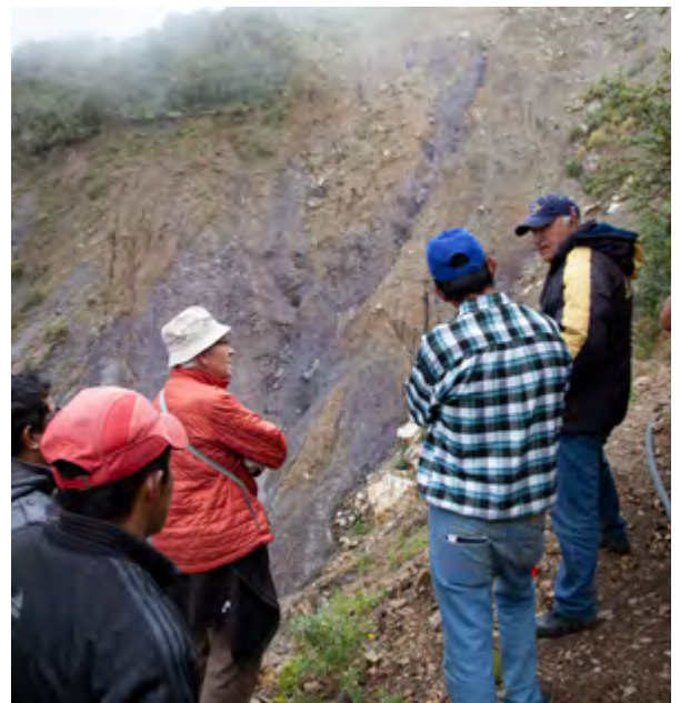
Sur place, le constat est évident