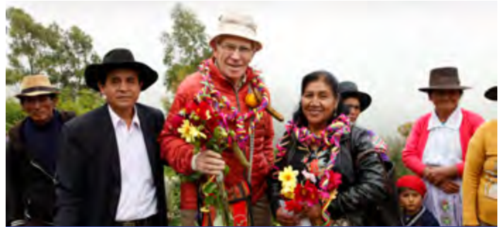
Un accueil on ne peut plus chaleureux à Rayme Alto