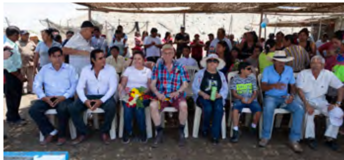
De nombreux invités à l'inauguration