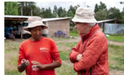
Les discussions révèlent un besoin d'appui au niveau de la gestion

du district de Tambillo, nous allons intervenir pour renforcer l'organisation de chaque comité d'eau des quatre villages. Une première réunion, entre le comité d'eau et notre intervenante sociale, a été programmée pour le samedi 29 février.