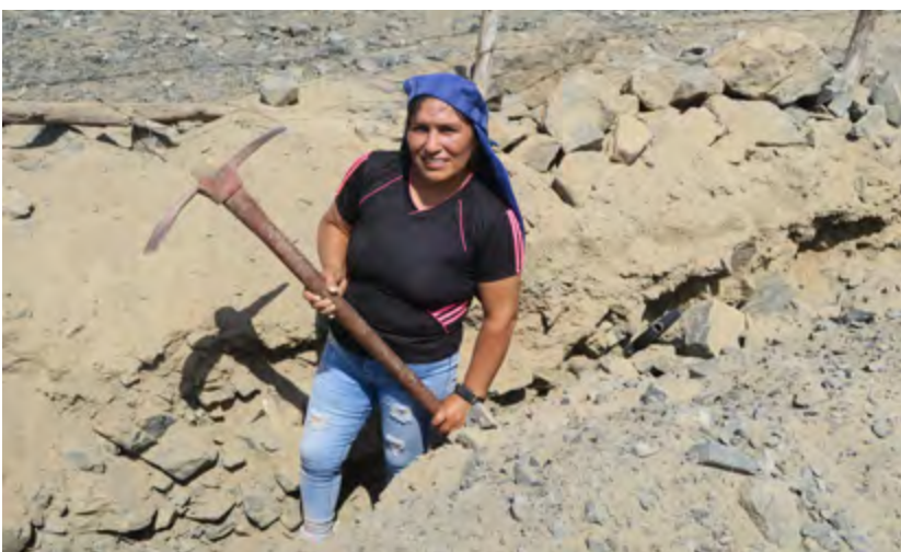
Une jeune maman participe au creusage d'une tranchée