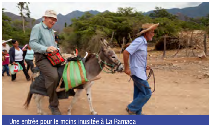
Une entrée pour le moins inusitée à La Ramada