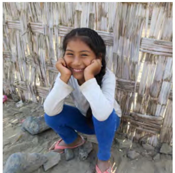
Une gamine de Villa los Ángeles