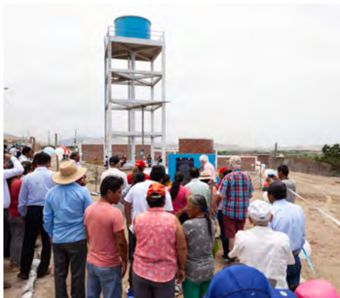
Le tout nouveau réservoir et ses panneaux solaires.