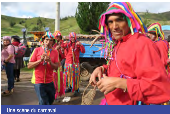
Une scène du carnaval

Nous quittons Ayacucho en plein carnaval. La fête dure cinq jours et des concours de danses folkloriques sont organisés.