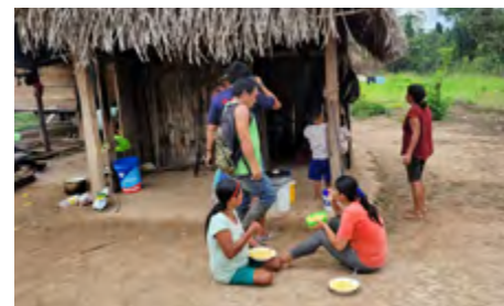
Une scène de la vie quotidienne

L'aide extérieure requise s'élève à 136 226 $. Ces autochtones de Tahuanti comptent sur votre appui pour vivre dans la dignité et en santé. Merci!