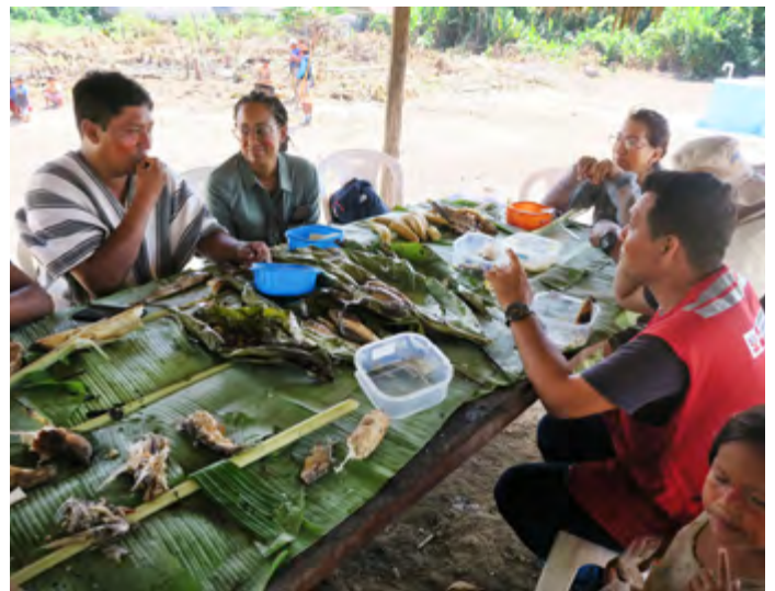
Des feuilles de bananiers en guise de nappe pour le repas à Nueva Galilea