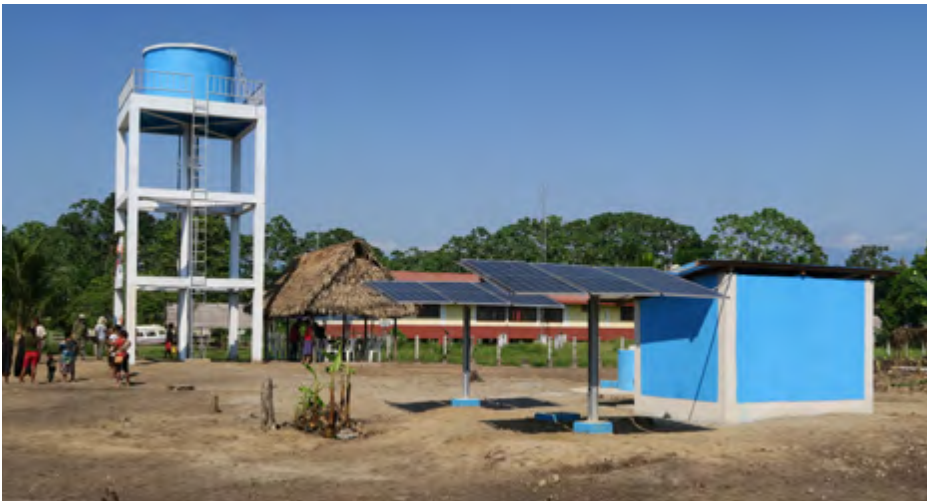
Les infrastructures de Nueva Galilea