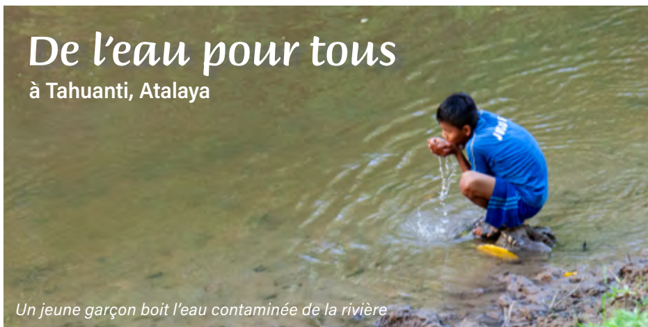
Un jeune garçon boit l'eau contaminée de la rivière

La communauté autochtone de Tahuanti sur le fleuve Ucayali compte 66 familles (335 habitants) de l'ethnie Asháninka. Le village n'a ni électricité, ni eau potable. Les mères de famille puisent leur eau dans la quebrada. Cette eau est très contaminée par les feuilles qui pourrissent et tous les déchets incluant des animaux morts jetés par les communautés en amont.