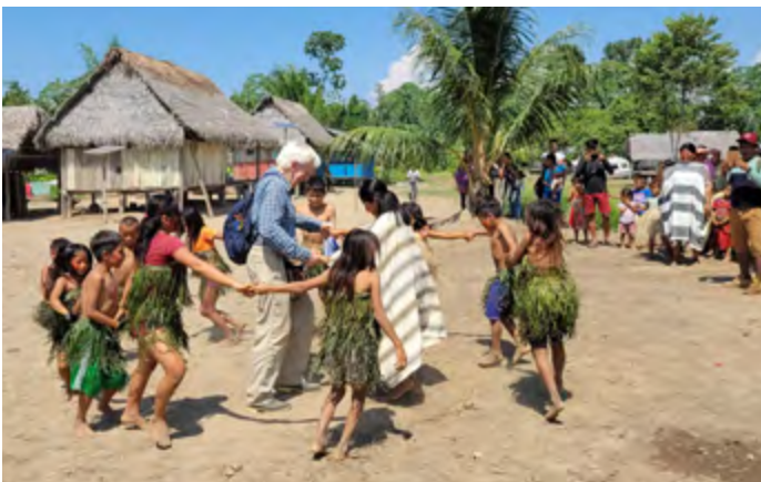
La fête de l'eau à Nueva Galilea