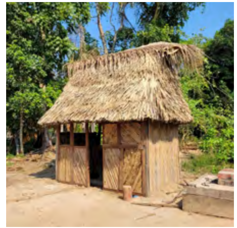
Une toilette moderne en Amazonie : cette hutte abrite le lavabo et la douche. Bravo aux artisans de Santa Clara !