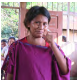
Témoignage émouvant d'une mère de famille

Lors de notre visite en août dernier, nous avons été secoués en écoutant le récit des mères de famille et des professeurs de la