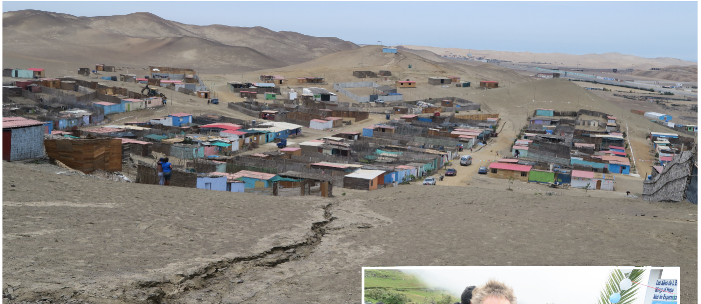
Le nouveau village de 21 de Septiembre, El Porvenir

Depuis novembre dernier, Nicole Bergeron est membre du conseil d'administration et trésorière (elle est comptable de formation). Elle nous livre ci-après ses impressions.