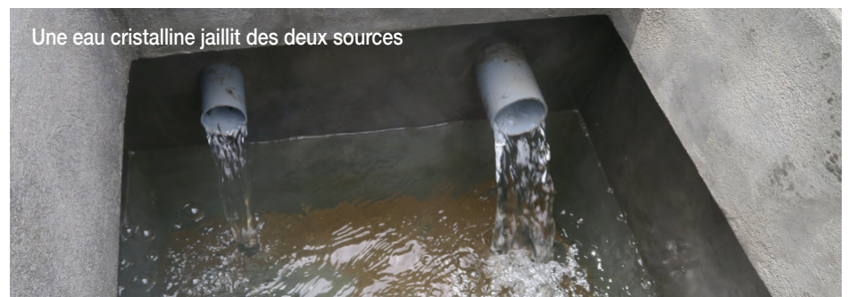
Une eau cristalline jaillit des deux sources

Le nouveau comité de gestion élu est composé de deux personnes, une femme et un homme, de chacun des cinq villages et d'un délégué de la Municipalité.