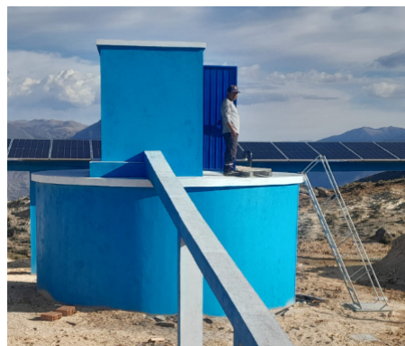
La citerne intermédiaire de Saurama

Le mercredi 11 février, la communauté de Saurama nous attend pour inaugurer l'agrandissement de leur système d'eau. Le premier système réalisé au début des années 2000 est devenu