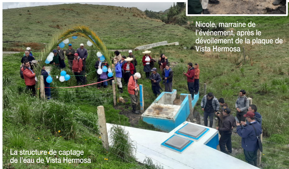
La structure de captage de l'eau de Vista Hermosa