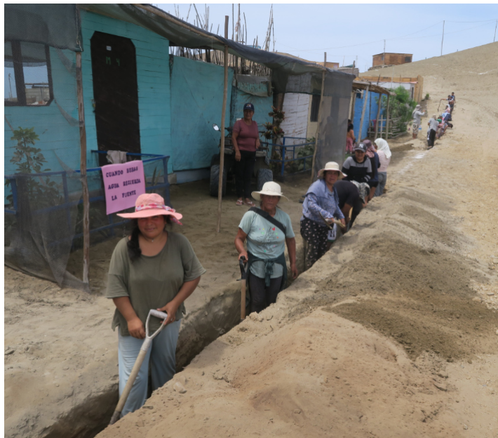
Les femmes participent allégrement au creusage de la tranchée à 21 de Septiembre

La Journée mondiale de l'eau 2026 est consacrée à l'eau et à l'égalité des sexes. Aujourd'hui encore, l'absence de systèmes d'eau potable creuse les inégalités . En effet, la crise mondiale de l'eau ne touche pas de la même manière les femmes et les hommes. Ce sont les femmes et les jeunes filles qui ont la responsabilité de collecter l'eau pour la famille. Elles y consacrent de nombreuses heures par jour . Cette tâche les empêche d'étudier ou de travailler contrairement aux garçons et aux hommes et les expose à des violences.